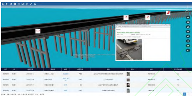
图 9. 基于 BIM 的桥梁巡检养护管理

将其挂接到模型上,实现巡检养护内容的四维可视化表达;2)将每个构件的巡检养护周期和实际执行情况与BIM模型集成,对巡检养护执行进度进行可视化管 理;3)通过不同颜色对构件的技术状况进行形象化展 示,并且可以查看每个构件详细的病害及养护情况, 增强管养针对性,做到养护管理工作有的放矢,提高 工作效率;4)对巡检养护出勤轨迹进行记录,通过 BIM展示派工单内容和作业现场情况,在BIM模型上 对病害养护措施及处置建议进行三维批注,并将作业 情况通过智能手机APP上报,形成作业前后图像对比, 从而实现巡检管养的全流程标准化和信息化。