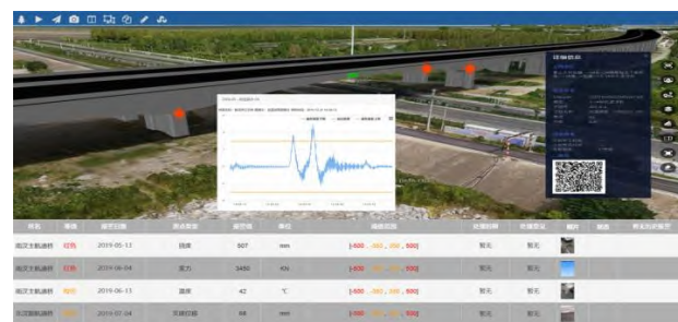
图 8. 基于 BIM 技术的监测报警功能